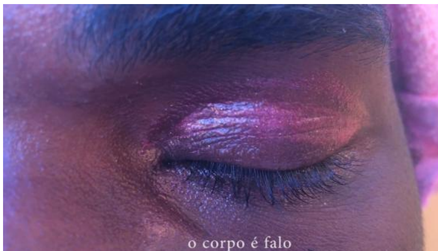
FIGURAS 5,6 E 7

Stills do vídeo Close de bixa preta , Nelson Almeida, 2016, acervo do artista.